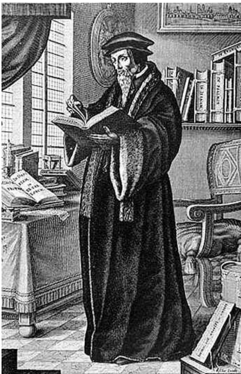
Giovanni Calvino nel suo studio in un'incisione del 1877